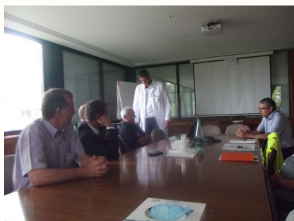
Lors de la présentation de l'usine SUPERFOS

La commune remercie vivement les personnes qui ont accueilli la délégation et organisé les visites.