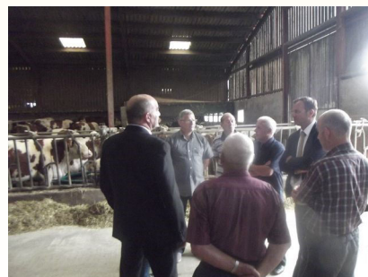
Par sa curiosité, M. le Sous Préfet démontrera que le monde agricole lui tenait à cœur.