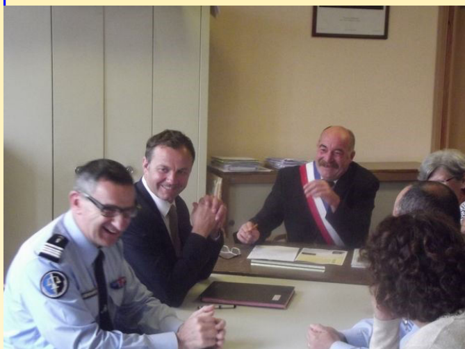
Une visite sérieuse, mais dans la bonne humeur.

Cet après-midi s'est déroulé en plusieurs temps: